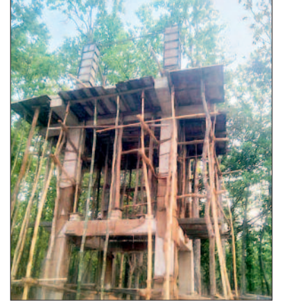
हरिभूमि न्यूज ►►रेंगाखार

वन परिक्षेत्र रेंगाखार के अंतर्गत सर्किल रेंगाखार स्थित गोपीखार बांध पर निर्माणाधीन रिजॉर्ट प्रोजेक्ट में अनियमितताओं और संभावित भ्रष्टाचार के आरोप सामने आए हैं। करोड़ों रुपए की लागत से बनाए जा रहे इस प्रोजेक्ट में निर्माण गुणवत्ता, लागत की पारदर्शिता और तकनीकी निगरानी को लेकर गंभीर प्रश्न खड़े हो रहे हैं। स्थानीय स्तर पर